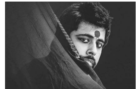
इंग्लिश नाटक फ्लेश का मंचन, दि लिटिल थियेटर ग्रुप ऑडिटोरियम, मंडी हाउस में शाम 4 बजे से।