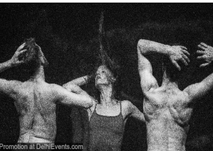
यामा कंटेम्प्लरी डांस शो, ऐलियांस फ्रेंचाइज में शाम 7 बजे से।