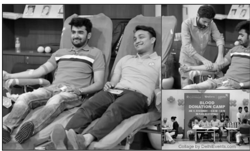
4वां ब्लड डोनेशन कार्यक्रम, सिलेक्ट सिटीवॉक, साकेत में दोपहर 12 बजे से।