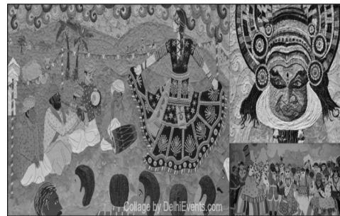
दि डांस ऑफ इंडिया एंड ऐलन सोलो आर्ट शो, बीकानेर हाउस, पंडारा रोड में शाम 6.30 बजे से।