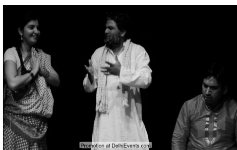
हिंदी कॉमेडी नाटक किस्सों का चौबारा का मंचन, लोक कला मंच, लोदी इंस्टीट्यूशनल एरिया में शाम 5 बजे से।