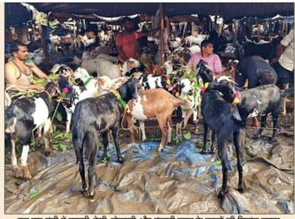
इस बार मंडी में बरबरी, देसी, तोतापरी और पंजाबी नस्ल के बकरों की डिमांड ज्यादा

मोहन गार्डन | अर्जुन नगर | छतरपुर | शिवालिका | घोडा | गुरु नानक नगर | मीरा बाग | खेल गांव | गौतम नगर | पुष्प विहार | नागलोई | बादली | रेमेरा पार्क | दरियागंज | सुभाष नगर | दलपुरा | देवली | कृष्णा नगर | बदरपुर | तिगड़ी | मोहम्मदपुर | सागरपुर | साध नगर | लोनी | महावीर एन्क्लेव | लोदी कॉलोनी