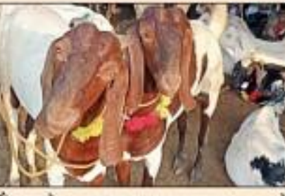
1। सबसे कम दाम का बकरा 12 हजार रुपये में बेचा है।

बकरे बेचने आए यामीन ने बताया कि उनके एक बकरे का नाम सलमान खान की फिल्म सुल्तान पर रखा गया है। इस बकरे की मर्दान के पास उर्दू में अल्लाह नाम बना हुआ है। यही कारण है कि यामीन इसके 5-15 लाख रुपये तक की डिमांड कर रहे हैं। इसके अलावा यामीन के पास एक बकरा और है, जो देसी नस्ल का है। इसका नाम अल्लाहखान है और इस पर उर्दू में मोहम्मद नाम बना हुआ है। इस बकरे की भी कीमत 2-5 लाख रुपये तक बताई जा रही है। हापुड से यहां आए हैं। उन्होंने बताया कि करीब 150 बकरे बेचने आए थे, जिनमें से ज्यादातर बिक चुके