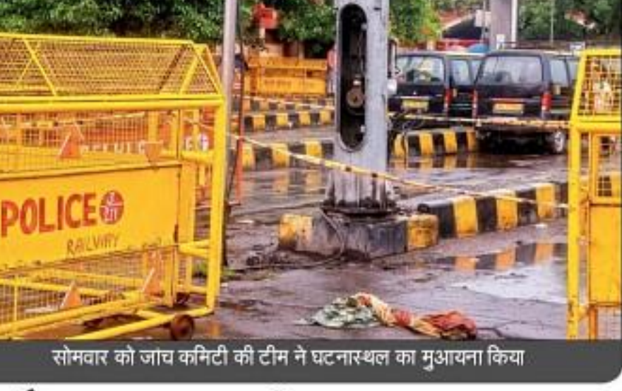
सोमवार को जांच कमिटी की टीम ने घटनास्थल का मुआयना किया

रेलवे के एक अधिकारी ने बताया कि जांच समिति में सीनियर कमर्शल मैनेजर, सीनियर डिविजन सेफ्टी ऑफिसर और आरपीएफ के सीनियर डिविजन सिक्समोर्टी कमिश्नर शामिल हैं। इस जांच समिति के अलावा रेलवे पुलिस अगनेंस्तर से भी जांच कर रही है। सोमवार को रेलवे पुलिस ने स्टेशन के बाहर लगे सीबीटीवी कैमरे को भी खंगाला। सूत्रों का कहना है कि जांच समिति मृतक महिला के परिजनों से भी मुलाकात कर उनके बयान दर्ज करेगी।